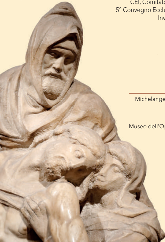
Michelangelo, Pietà Bandini , 1547-1555 circa, statua in marmo, altezza 226 cm. Museo dell'Opera del Duomo, Firenze.

CEI, Comitato preparatorio al 5° Convegno Ecclesiale Nazionale, Invito al Convegno